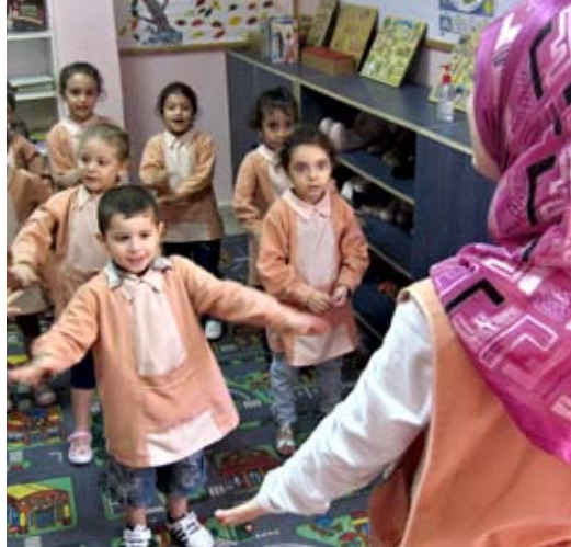
En undervisningssituation i en af Kanafanis børnehaver.